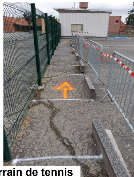
Entrée côté terrain de tennis

Côté crèche (voir photos ci-dessous), un balisage a été fait sur le trottoir qui relie les deux écoles et aussi dans l'enceinte de l'école pour permettre aux élèves des classes de ne pas se croiser et emprunter un parcours unique.